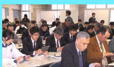
熱心に研修に励む教職員（12/17）