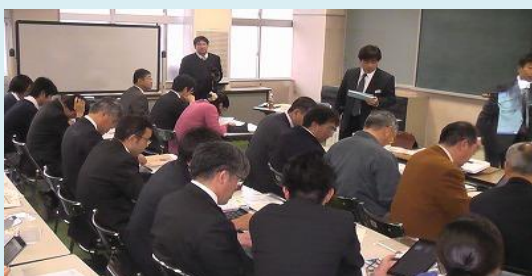
指導主事から指導を受ける教職員（12/17）