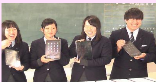
i P a d を手に喜ぶ生徒会役員

購入の半数については、「東日本大震災復興を支援する会」（兵庫県立西宮高校 S 4 2 年卒業生有志）の皆様から今年いただいた多額の義援金を利用させていただきました。「東日本大震災復興を支援する会」をはじめ各団体の皆様に対して心よりお申し上げます。これを機に、皆様の思いやご期待に応えられるように、授業では勿論のこと、行事・部活動等で利用することとしております。i P a d 導入後の様子等について写真でお知らせします。