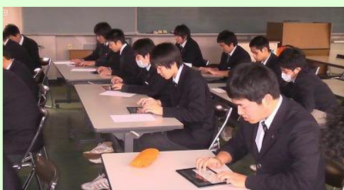
i P a d の基本を学ぶ3年生（12/24）