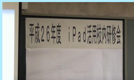
校内研修会（12/17 大講義室）