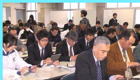
熱心に研修に励む教職員（12/17）