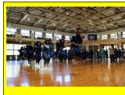
(合宿二日目のクラス対抗スポーツ大会：長縄跳びと綱引きを行い、クラス全員が力を合わせて一つになりました。)