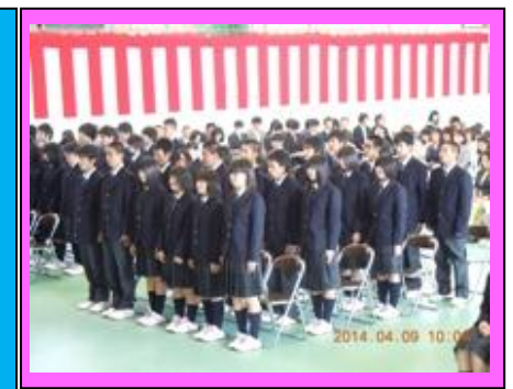
(担任の呼名で大きな声で返事をし起立しました。)