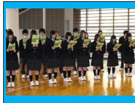
(校歌練習の風景です。)