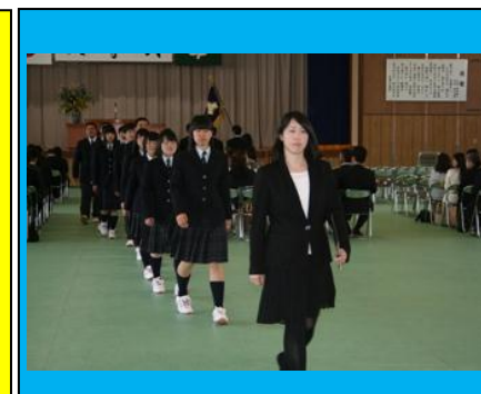
(担任を先頭に生徒が退場しました。)