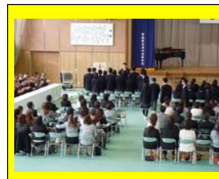
(多くの来賓、保護者に見守られての入場です。)

新入生は緊張した面持ちで入学式場に入場しました。担任から一人ひとりの名前が呼ばれると、「はい」という大きな返事が体育館に響きわたりました。校長の式辞では、「師匠は針の如し、弟子は糸の如し」という格言を引き合いに出して、「師匠である先生は針のように道筋を示してくれる存在であり、弟子である生徒は糸のように師匠から離れることなくついていくことによって、物事がうまくいくのです。先生の指導をしっかり受けて下さい。」と志高生としての心構えを伝えられました。ご来賓の方々からは、「南三陸町の復興は、若い皆さんの力によってなされていきます。がんばって下さい。」と祝辞をいただきました。