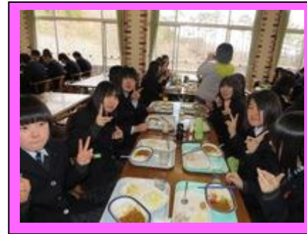
(おいしい食事をいただき、交流を深めました。)