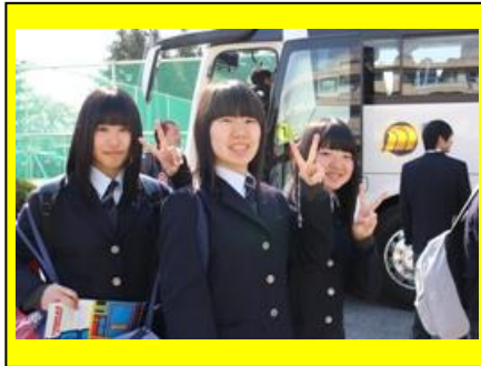
(オリエンテーション合宿へ出発する様子です。)

ガイダンスでは熱心に先生方の話に耳を傾けており、クラス対抗スポーツ大会では全力で体を動かすなど、充実した時間を過ごすことができ、3つの目的は充分達成されました。