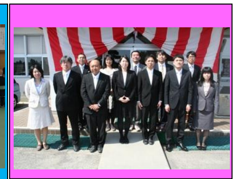
(1学年団です。よろしくお願いします。)