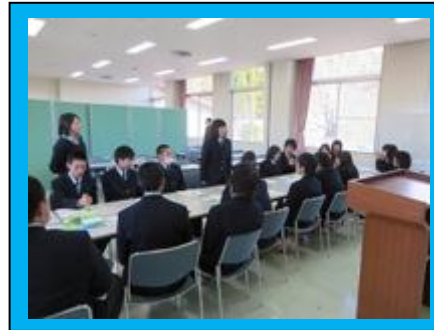
(クラスごとの話し合いで、委員会メンバーを決めました。)