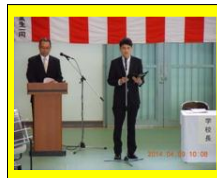
(担任も緊張した面持ちで呼名をしていました。)