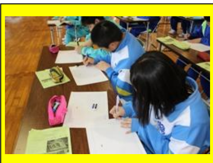
(高校での抱負を作文にしました。)