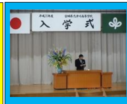
(校長式辞では、新入生への期待が伝えられました。)