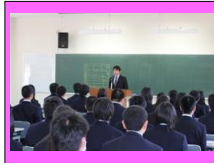
(みんな熱心にガイダンスを受けました。)