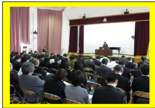
(全体会の様子：100名あまりの教員が集まりました。)