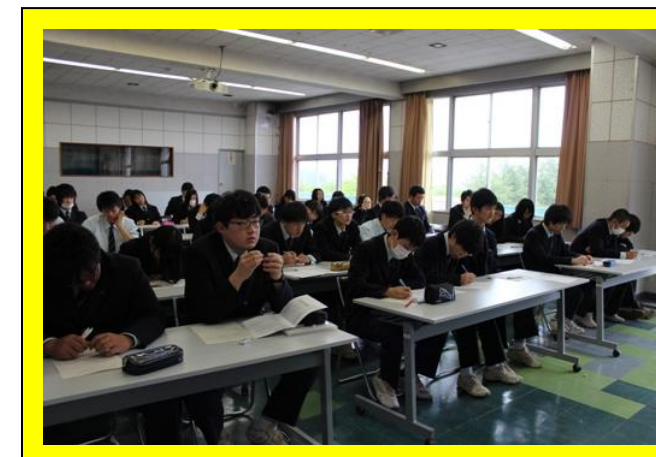
(就職ガイダンス：入社試験の内容やそれに向けて、今すべきことを学びました。)