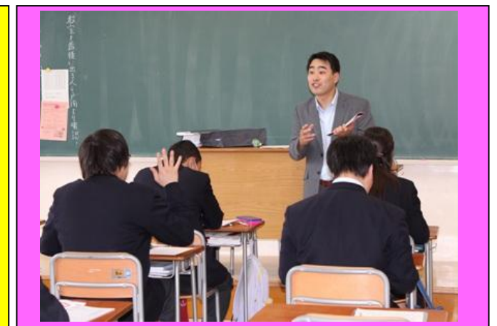
(大学進学ガイダンス：高3の今の時期にすべきことなど、具体的な話を聞きました。)