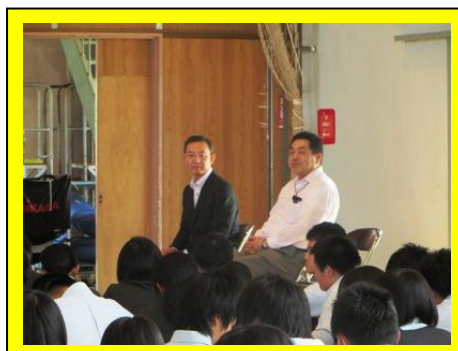
(宮城県警本部と南三陸警察署から2名の警察官を招き、講話をしていただきました。)

インターネットを介したトラブルは、本校でも起きています。インターネットを正しく使用するよう継続的な指導をおこなっていききたいと思います。