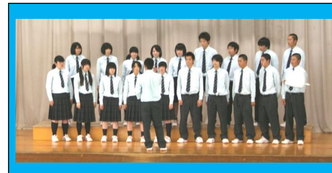
(銅賞受賞の1年3組。1年生も上級生に負けず大健闘!)