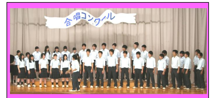
(銀賞受賞の3年4組。3年生の意地を感じました。)