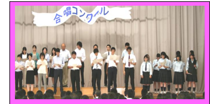
(全クラスの合唱が終わってから、アトラクションとして、音楽部の生徒と先生方が美声を披露してくれました。曲は「涙をこえて」でした。)