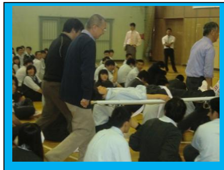
(行方不明の生徒を捜索し、発見した後に搬送訓練をしました。連絡体制の確認をしました。)