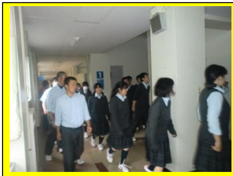
(教員の指示に従って避難をしているところ。静かに慌てず行動していました。)

6月12日(木)、雨の降りしき中、地震が起きた想定で防災訓練が行われました。5月23日(金)に、地震についての事前学習を行い、今回の避難訓練でそれを実践しました。生徒全員が真剣に取り組みました。南三陸消防署から4名の消防士に來校していただき、訓練を講評していただきました。負傷者が出た場合の迅速な対応の仕方など、学ぶことが多い防災訓練となりました。