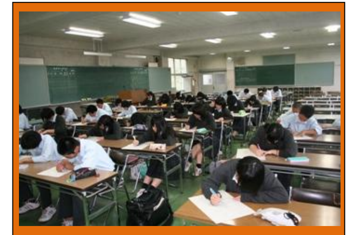
（チャレンジテストの様子です。全員がテストに合格するまで、放課後を使っての補習や再テストを行っています。）