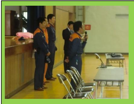
(消防士の方から避難時の具体的なアドバイスをいただきました。)