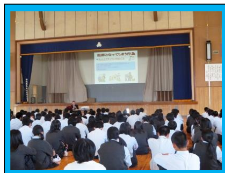
(スライドを用いて、ネットの危険性を具体的に学んでいきました。)