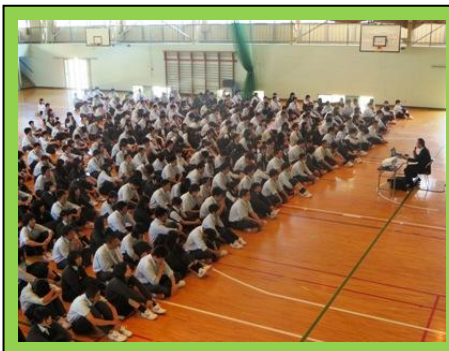
(全校生徒が熱心に講話を聞きました。)