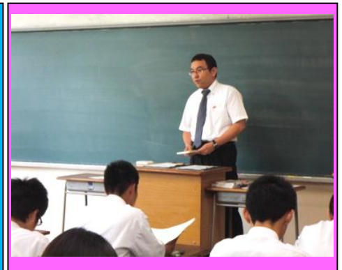
(社会科の授業体験。青年期の心の特徴について先生が熱く語りました。)