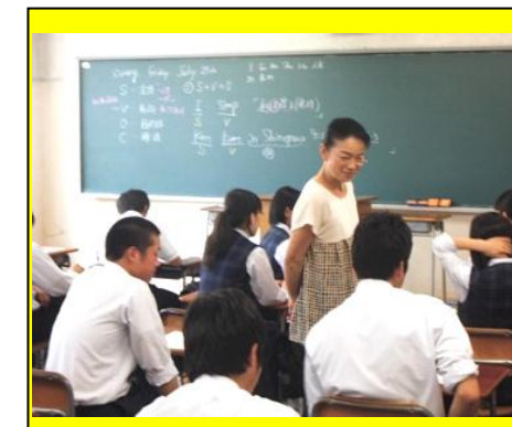
(英語の授業体験。中学生が苦手としている英語を、文法を交え分かりやすく解説しました。)