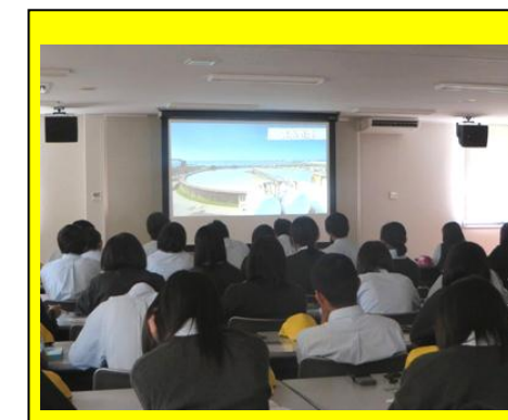
(日本製紙石巻工場の説明。紙ができるまでを分かりやすく説明していただきました。)