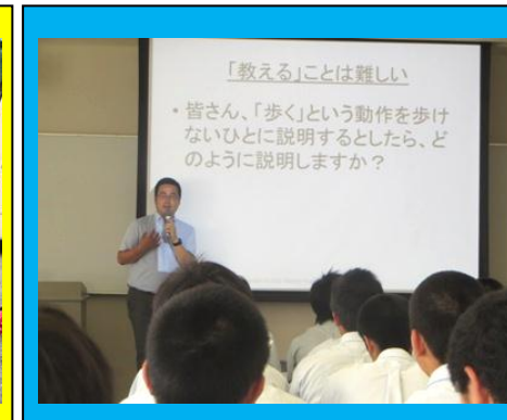
(石巻専修大学での模擬授業。心理テストを交えながら、心理学について学びました。)