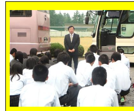
(出発前、校長先生から生徒へ、「積極的に学んできて下さい。」と見学会への心構えを伝えられました。)

進路希望が進学か就職かに関わらず、自分の将来について考えることができた有意義な行事でした。