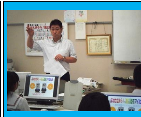
(商業の授業体験。高校で初めて学ぶ教科です。情報ビジネス科についての説明を聞きました。)