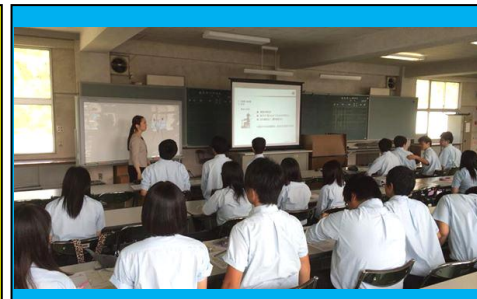
(就職達成セミナーの様子(7/31)。入社試験を目前に控え、真剣なまなざしで講師の話の話を聞きました。)