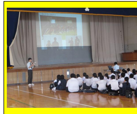
(全体会では、生徒会執行部が中心となって、学校紹介をしました。)

7月25日(金)に、中学3年生を対象としたオープンキャンパスを実施しました。志津川中学校から66名、歌津中学校からは41名、その他の中学校から9名の参加がありました。全体会で本校紹介をした後、4つのグループに分かれて授業体験を行いました。参加した中学生たちは、校舎案内、部活動見学などを通して、本校の魅力を感じ、高校生気分になりました。