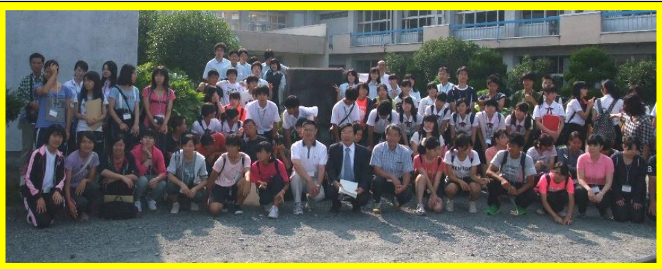
(神戸県立・神戸市立4高等学校との交流会の様子。神戸高校、御影高校、東灘高校、葺合高校から総勢59名が来校しました。「花は咲く」の合唱披露もあり、有意義な時間を過ごすことができました。)