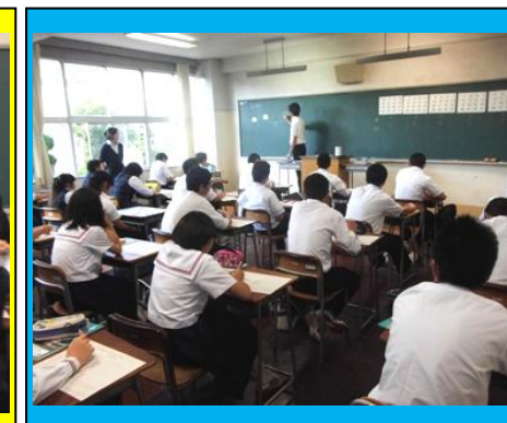
(数学の授業体験。志中生には乗り入れ授業で顔なじみの先生が、楽しい数学を解説しました。)