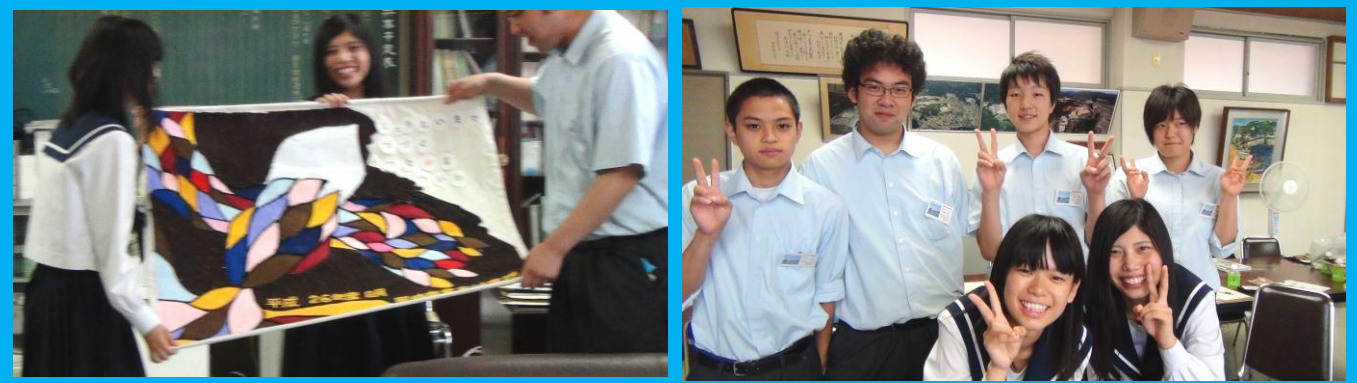
(岡崎商業高校との交流会の様子。震災があってから毎年、岡崎商業のみなさんは本校へ来て交流会をしています。)