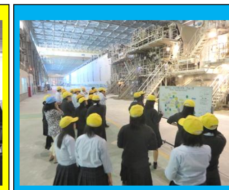
(日本製紙石巻工場内の見学。全長100mを超える巨大な機械が高速で紙を作っていく様子を見学しました。機械から発せられる音と熱を間近に感じ、働くことの大変さとやりがいなどたくさんのことを学ぶことができました。)