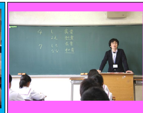
(国語の授業体験。古典は現代の生活に生きていることを伝え、中学生の関心が高まる授業を展開しました。)