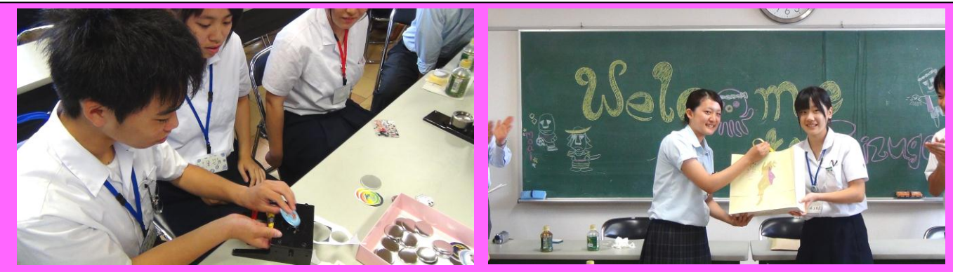
(小倉東高校との交流会の様子。モアイ化計画の缶バッジ作成を通して、交流を深めることができました。)