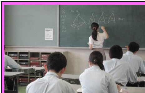
(公務員特別講習会(8/3)の様子。数的推理、判断推理の分野を中心に問題演習を行いました。)