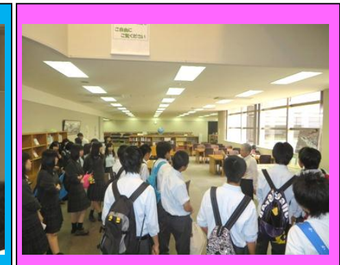
(石巻専修大学の図書館。膨大な図書をどのように管理しているか等、興味深い話をいただきました。)