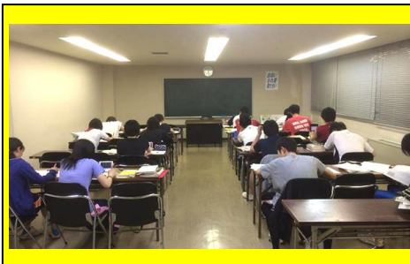
(学習合宿の様子(6/29)。一人ひとりが目標を持って学習に取り組みました。)

その他、就職模試、公務員試験対策模試、看護医療模試、大学入試模試を行っています。