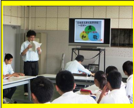
(生徒会執行部が各校の活動紹介をしました。写真は, 志津川高校の生徒会紹介の様子です。)