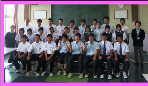
(中高生徒会執行部, 総勢26名が集まり, 有意義な話し合いができました。)