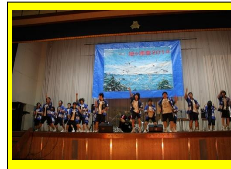
(1年1組のクラスパフォーマンスの様子です。どのクラスの出し物もよく考えられており, 会場は大変盛り上がりしました。)

9月5日(金), 6日(土)に, 『a traditional event ～志高90周年の歴史～』のスローガンのもと, 旭ヶ浦祭が行われました。5日の校内発表では, 文化部による発表, クラス発表と仮装行列が行われました。6日の一般公開では, クラスによる模擬店やステージ発表で盛り上がりました。