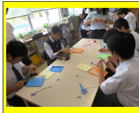
(図書委員交流会の様子です。和紙を使ったメモ帳作りのワークショップを開催しました。)