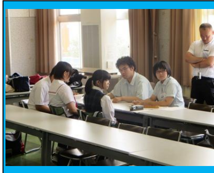
(今後の中高生徒会執行部の連携の在り方について, グループになって話し合いました。)