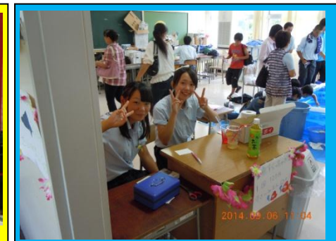
(クラス模擬店の様子です。各クラスごとに映画を作成したり, 縁日を再現したり, 飲食店などを行いました。多くのお客様に来店していただいたおかげで, 生徒一人ひとりが達成感を味わうことができました。)