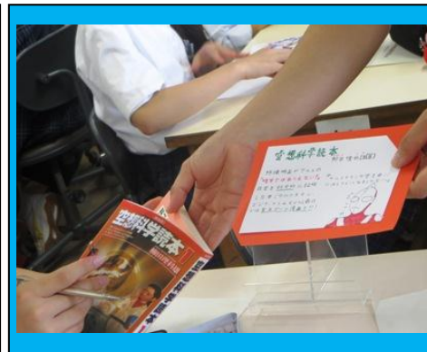
(図書館や本屋にあるような本紹介カードの作成を行いました。ユニークなカードができました。)