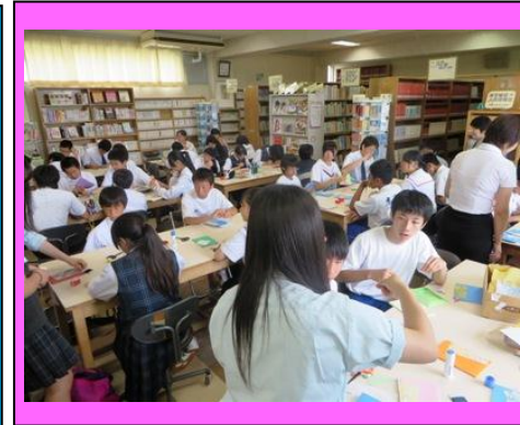
(志高図書委員が各テーブルでリーダーとなり, ワークショップをすすめました。)