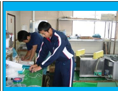
<アルファードiamond工業>