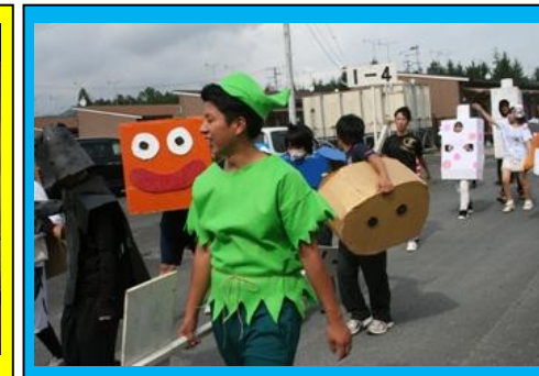
(毎年恒例の仮装行列です。さんさん商店街や周辺の仮設住宅周辺を, 旭ヶ浦祭のPRをしながら歩きました。)