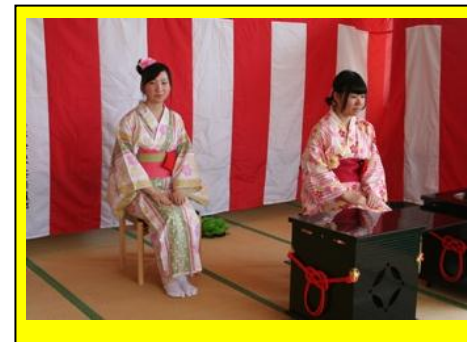
(茶華道部の様子です。日頃の活動の成果を発表しました。)