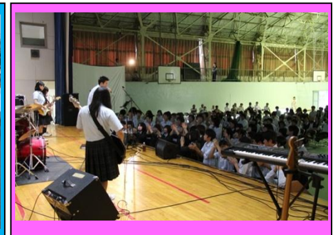
(軽音楽部の演奏の様子です。パンチのきいた演奏で全校生徒が盛り上がりました。)