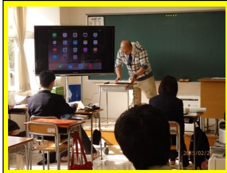
(簿記の授業です。生徒も徐々にiPadに慣れてきて、学習効率も上がるようになってきました)

本校では、新しいスタイルの授業展開を試みながら、学力の向上に取り組んでいます。ここでは、今年度導入したiPadを活用した授業実践のいくつかを紹介します。