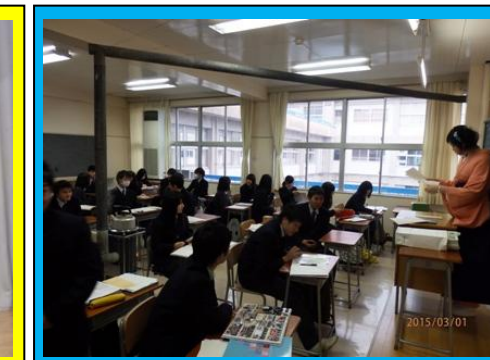
(各クラスで最後のLHRを行いました)