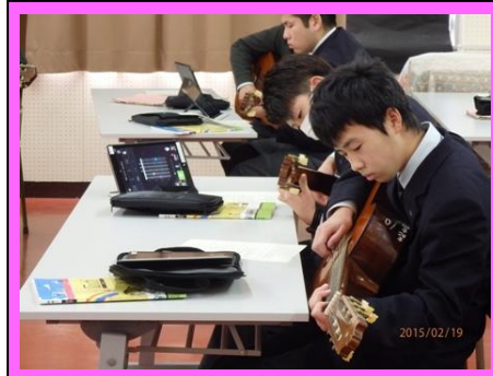
(音楽の授業です。iPadの画面に弦の押さえ方を映し出し、ギターを演奏しました)