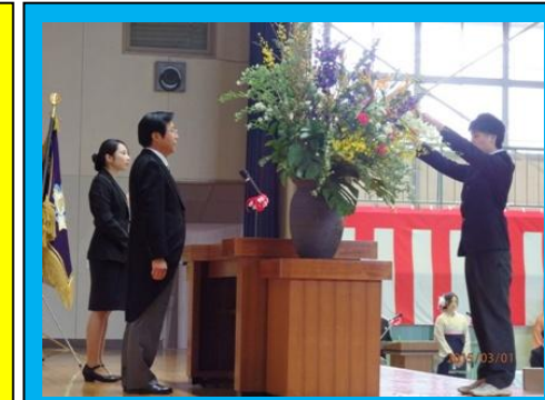
(各クラスの総代に卒業証書が授与されました)