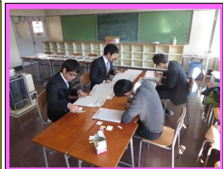
(取組内容を確認して、志高の教員が「つなぎ教材」にコメントを書いている様子です)