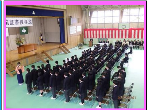
(情報ビジネス科1クラス、普通科3クラス、合計4クラスの115名の卒業生が巣立ちました)