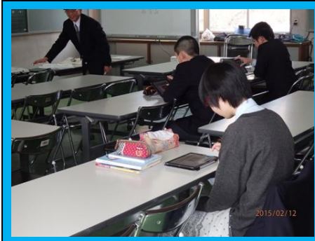
(世界史の授業です。生徒1人ひとりがiPadを手にして、インターネットに接続しました。デジタル教材を用いて学習内容の理解を深めました)