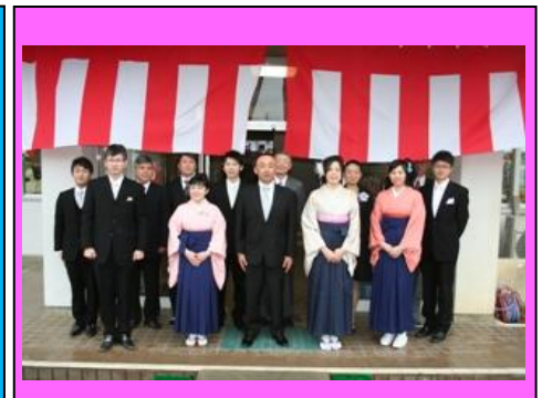
(卒業生と苦楽を共にした3学年の教員団です)