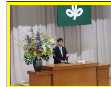
(南三陸町長(本校後援会長)の祝辞の様子。震災からの復興に向けて、若い力への期待の言葉が述べられました)