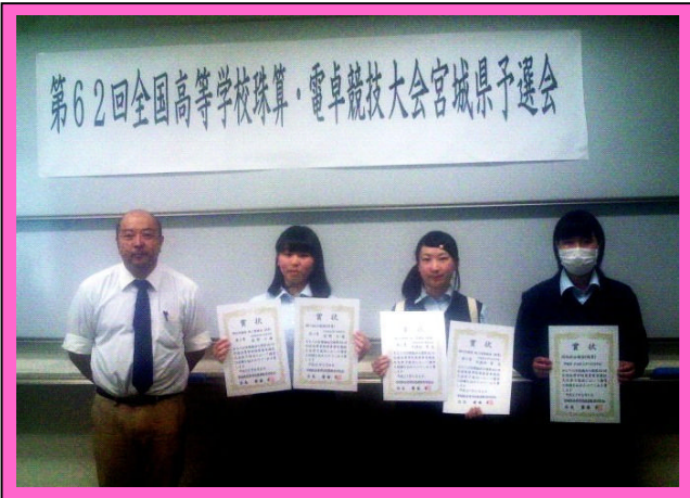
(全国高等学校珠算・電卓競技大会宮城県予選会での様子。県大会を制して、次は全国大会です。)

7月29日(水)、東京都立第三商業高等学校にて全国大会が行われます。力を出し切ってがんばってきて欲しいと思います。