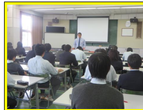
(2年生の就職希望者の分科会。高校生と社会人の違いについて, 話がありました。働くことの責任の大きさを実感することができました。)