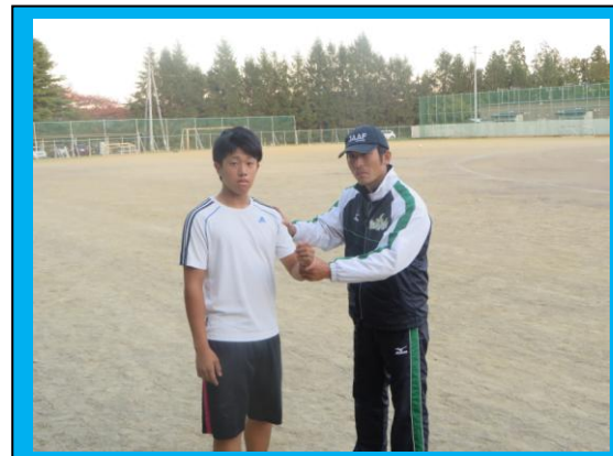
(陸上競技部を指導している様子。本校の陸上競技部は, 毎年, 県大会を突破して東北大会へ出場する選手を輩出しています。)