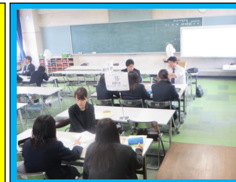
(大講義室など使って, 将来の仕事の各分科会を開きました。生徒は, 担当者から詳細な説明を聞くことができました。)