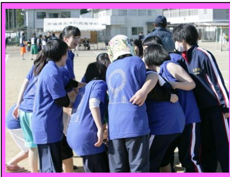
(体育祭を通して、一段とクラスもまとまりました。)