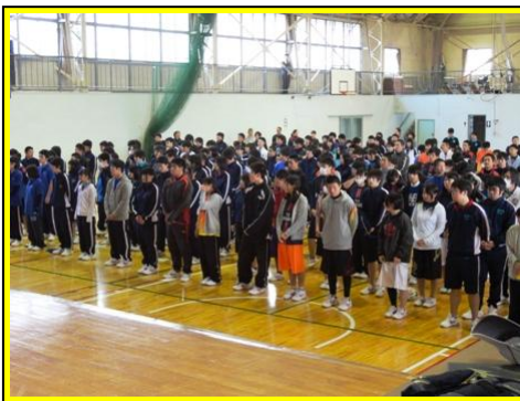
(開会式。クラスTシャツはそれぞれの個性が輝いていました。準備から運営まで、生徒主体で行いました。)

10月29日(木)、30日(金)に、体育祭を開催しました。本年度は、男女ともサッカーとバレーボールで順位を競い、白熱した試合が展開されました。 総合優勝 3年3組 準優勝 3年2組 第3位 3年4組, 2年3組 サッカー : (男子) 優勝 2年3組 (女子) 優勝 3年3組 バレーボール: (男子) 優勝 3年2組 (女子) 優勝 1年3組