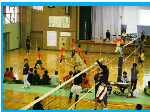
(男子バレーボールの様子。アタックをバシバシ打って得点するレベルの高い試合が展開されました。)