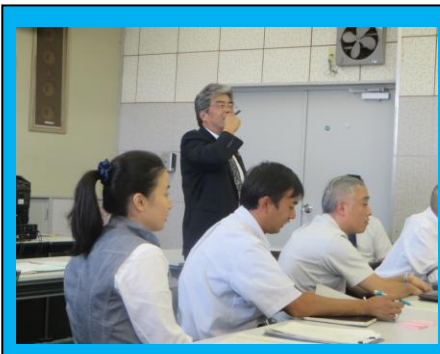
(前期期末考査の午後の時間に教員研修会を行いました。教員一人ひとりがいじめについてじっくり考えることができました。)