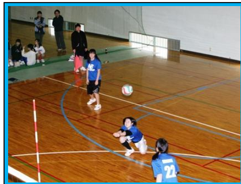
(女子バレーボールの様子。1年生が上級生を撃破する姿も見られ、盛り上がりました。)