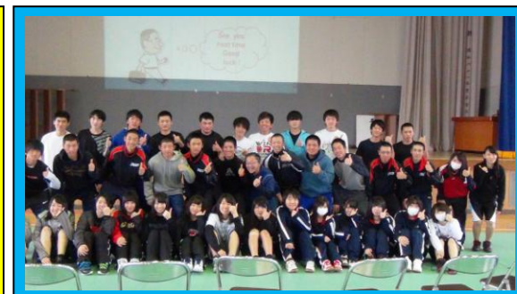
(日曜日午前の開催にもかかわらず、多くの生徒が参加してテーピングの基本を学びました。楽しい時間を過ごすことができました。)