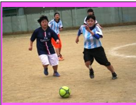
(女子サッカーの様子。全員で声を出して、ボールを追いかけていました。)