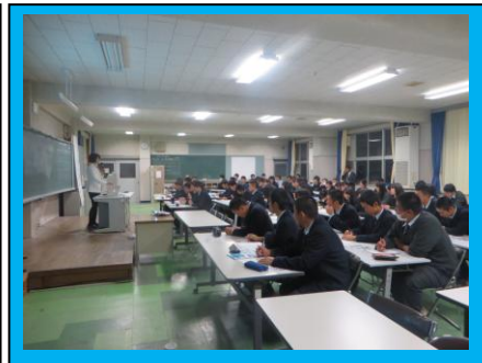
(震災の復興支援をいただいている方々の好意により支えられている研修会です。多くの運動部員が感謝の念を持って積極的に参加しました。)