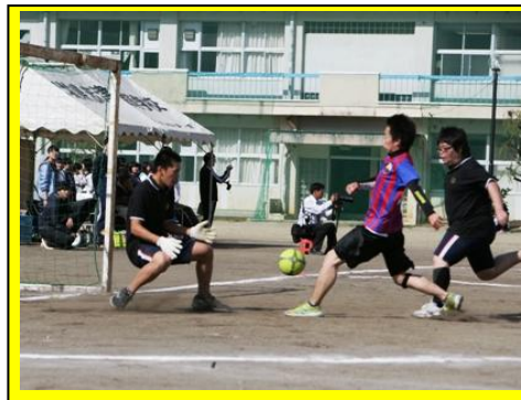
(男子サッカーの様子。身体をぶつけ合い、全員本気でゴールめがけてプレーしました。)