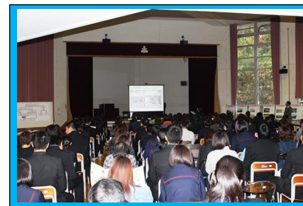
志津川中学校での高校説明会の様子（11/5）。今回初めて志高を説明する時間をいただきました。教育課程や生徒会活動、進路状況など詳しく説明をしてきました。