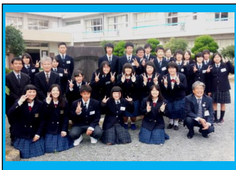
松江市立女子高校との生徒会交流会の様子。本校は全国から多くの生徒会が来校します。震災当時の話や、その後の様子などを語り合うよい機会となっています。