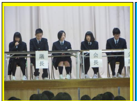
後期生徒総会の様子。来年度入学生から1クラス減の影響があり、生徒会活動のあり方などについて話し合いがなされました。（11/12）