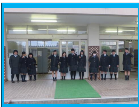
音楽部によるあいさつ運動。生徒会執行部の呼びかけに応じて、すべての部活動が行っています。