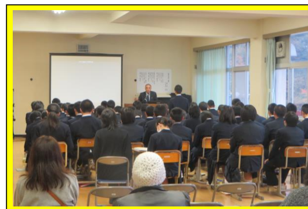
歌津中学校での高校説明会の様子（11/2）。中学1、2年生を対象に、毎年、志高の説明をしています。中学生は集中して話を聞いてくれました。

11月2日（月）に歌津中学校において、5日（金）に志津川中学校において、本校の学校説明会を行いました。本校の教員と生徒が中学校へ出向き、本校の良さを伝え、本校のアピールをしました。今年度は、志津川中学校の中学3年生と保護者を対象とした説明会を初めて開催することができました。一人でも多くの中学生に本校の良さを知って、興味を持ってもらいたいと考えています。