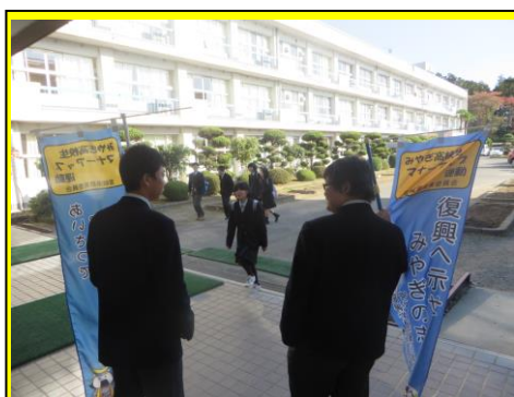
生徒会執行部のあいさつ運動。学校を盛り上げるため、生徒会執行部があいさつ運動を行いました。

11月12日（木）には後期生徒総会も行いました。その他、生徒会交流会など、本校の生徒会は様々な場面で活躍が期待されています。志高通信でも生徒会の活動をお知らせしていきます。