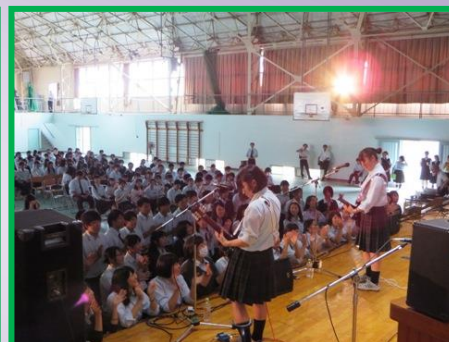
文化部発表やクラス模擬店、ライブも盛り上がりました。仮装行列はさんさん商店街でも行いました。