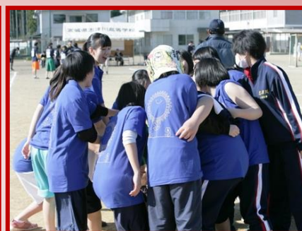
バレーボール、サッカーの2種目で男女ともに白熱した試合が展開され、クラスが団結しました。