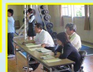
全校生徒がクラスの威信をかけて一生懸命に歌いました。